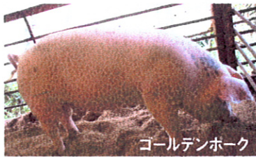
ゴールデンポーク